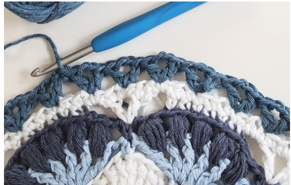
Runde 12: Viele V-Maschen

Befestigen Sie Ihr Garn in einer beliebigen M, 3 Lm (zählen als 1:a Stb), 2 Lm, Stb in dieselbe M, *2 M überspr, [Stb, 2 Lm, Stb] in nächste M, wiederholen bis zum Ende der Runde, abschliessen mit Km in erste M und zu Farbe 2 tauschen, mit der Sie das Garn durch die Km ziehen. Farbe 1 NICHT abschneiden, sondern auf der Rückseite ruhen lassen. (38 V:M = 76 Stb + 76 Lm)