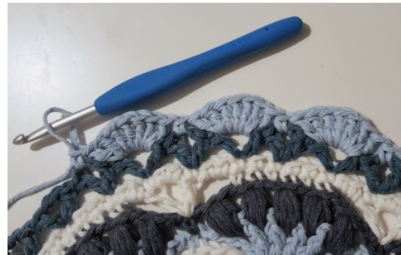
Runde 13: fM in ein V, Sonnenstrahl ins nächste V.

Km in nächsten Lm-Raum zwischen 2 Stb, Lm (zählt nicht als M), *fM in V-M/Lm-Raum, 7 Stb in nä V/Lm-Raum, wiederholen bis zum Ende der Runde, abschliessen mit einer Km in erste fM und das Garn zur Farbe 1 tauschen, indem Sie das Garn durch die Km ziehen. (19 Sonnenstrahlen (=133 Stb) +19 fM)